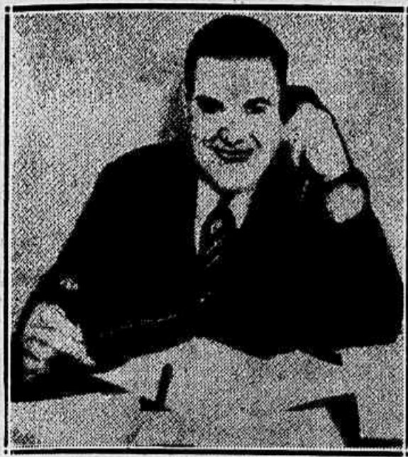
O governador Harold Hoffman

Mas não influin na decisao da Corte de Perdoes